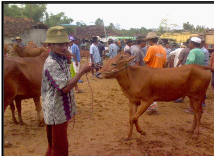
Gambar 8. Tukang Teguk