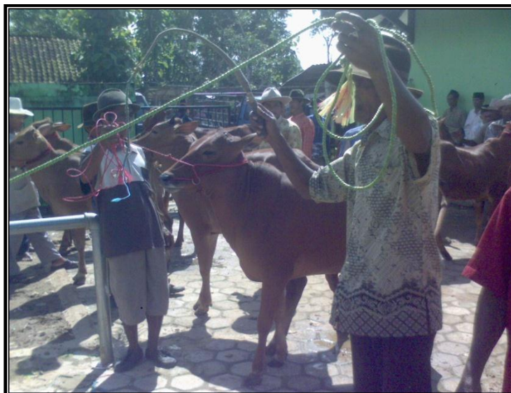
Gambar 9. Tukang Pecut

b. Nilai jasa tukang pecut disesuaikan dengan kondisi pasar, umumnya di bawah nilai teguk yakni Rp 10.000,- yang ditanggung oleh blantik .