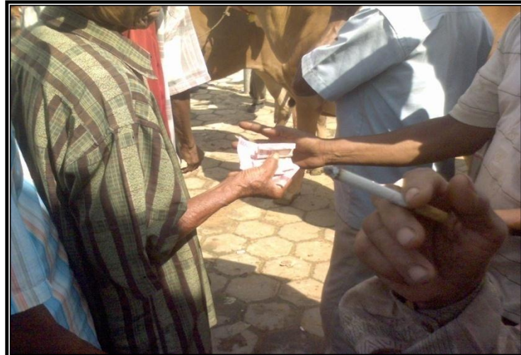
Gambar 6. Pembayaran Retribusi Ternak

Penjual yang menggunakan sarana pasar dikenakan retribusi sesuai dengan jumlah ternak yang akan dijual. Besarnya retribusi tidak berdasarkan besar kecilnya tetapi dihitung per ekor sapi yakni Rp 5.000,- yang ditanggung oleh pemilik sapi/penjual.