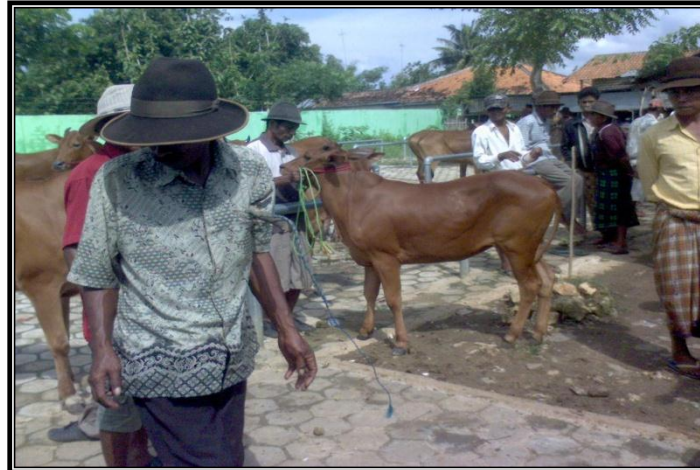
Gambar 4. Pasar Sebelah Barat Sapi Dara, Induk (Betina) dan Jantan