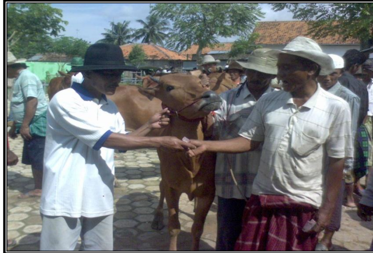
Gambar 12. Transaksi Jual Beli Sapi Dipasar Hewan Pakong

baik dalam hal memperoleh keuntungan maupun nilai tawar, karena peternak harus membayar nilai jasa blantik dan tukang teguk/pecut maupun memperoleh harga yang relatif rendah akibat ketidaktahuan peternak terhadap informasi harga. Proses jual beli sangat ditentukan oleh pelaku pasar ( blantik ).