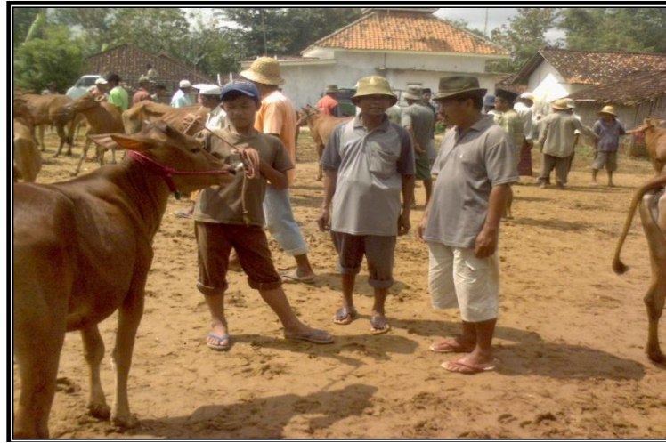
Gambar 11. Blantik dalam Melaksanakan Kegiatan Jual Beli