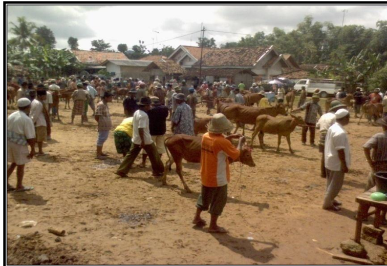
Gambar 5. Area Pasar yang Terdapat Dilahan Kosong

Sapi sapi yang sudah terjual yang ditambahkan oleh pedagang.