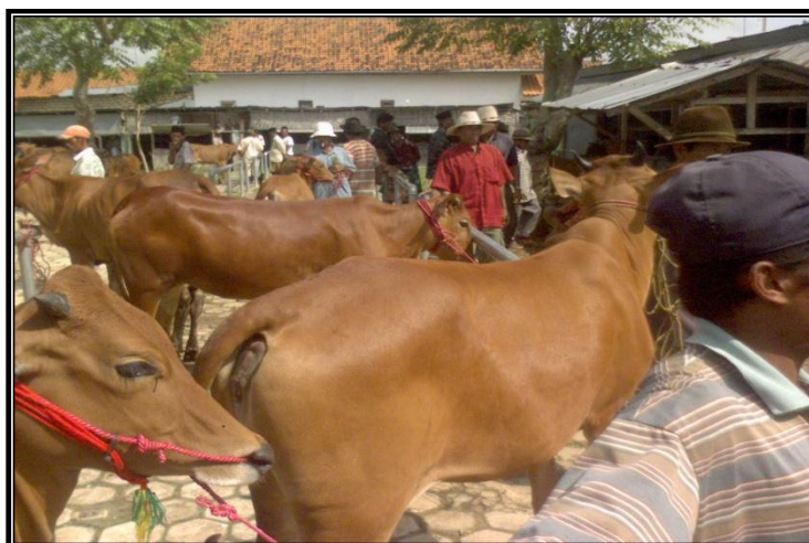
Gambar 3. Pasar Sebelah Timur yang Menjual Sapi Umur 2.5 Tahun

Sapi yang mempunyai rata-rata 300 kg (umur > 2,5 tahun), untuk konsumen jagal luar Pulau Madura.