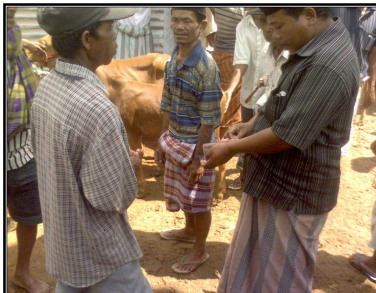
Gambar 7. Blantik yang Sedang Melakukan Transaksi dengan Peternak