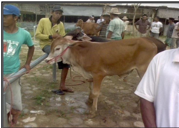
Gambar 2. Pasar Sebelah Utara yang Menjual Pedet

Area penjualan sapi pedet, yaitu di bawah 1,5 tahun untuk memenuhi konsumen peternak